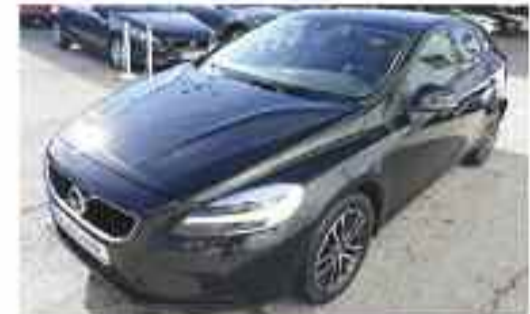
VOLVO V40 T2 MOMENTUM AUTO Compacto | Gasolina | 90 KW (122 CV) Automático | 5 puertas | 5 plazas | 22.000 kms Precio Oferta: 18.900 €