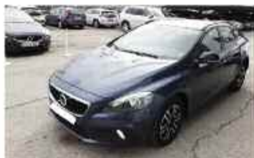
VOLVO V40 CROSS COUNTRY 2.0 D3 MOMENTUM AUTO (150 CV) Compacto | Diesel | 5 puertas | 21.000 kms Precio Oferta: 21.300 €