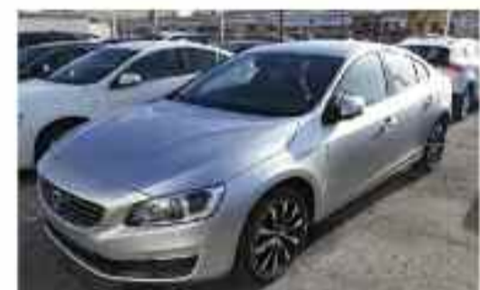
VOLVO S60 T3 MOMENTUM AUTO Berlina / Sedan | Gasolina | 152 CV Automático | 4 puertas | 5 plazas 20.300 Km Precio Oferta: 24.900 €