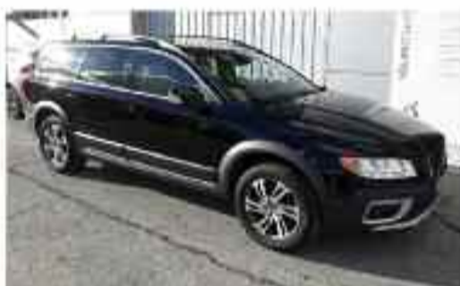
VOLVO XC70 2.4 D4 AWD MOMENT. (163 CV) Familiar | Diesel | 135.500 kms Cambio manual | 5 puertas | 5 plazas Precio Oferta: 19.900 €