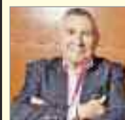
Luis de Blas Poeta / Escritor