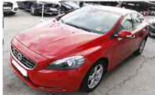
VOLVO V40 1.6 D2 KINETIC 115CV Compacto | Diesel | Cambio manual | 5 puertas | 5 plazas | 88.300 kms Precio Oferta: 12.900 €