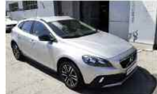
VOLVO V40 CROSS COUNTRY D2 MOMEN. Compacto | Diesel | 120 CV | 23.000 kms Cambio manual | 5 puertas | 5 plazas Precio Oferta: 17.650€