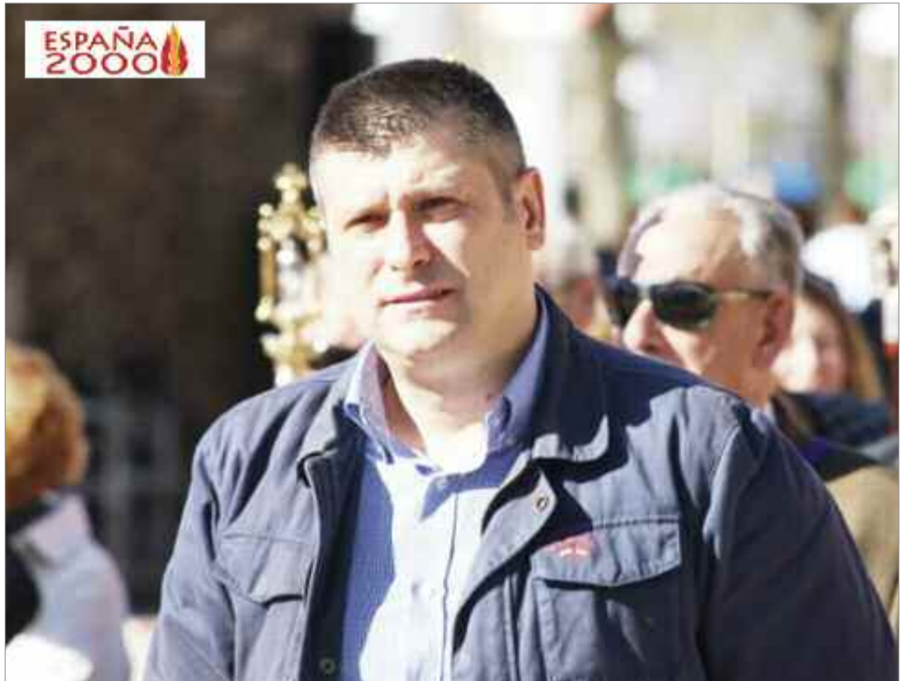
Rafael Ripoll, candidato a la alcaldía de Alcalá de Henares por España2000

Rafael Ripoll: El principal... son tantos, quizá la falta de empleo para los jóvenes de esta ciudad, jóvenes que se ven obligados a largarse porque no se protege su futuro aquí. Hay una gran incertidumbre, no hay perspectivas