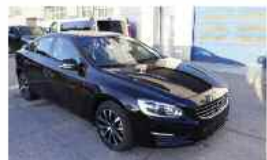
VOLVO S60 T3 MOMENTUM AUTO 152 CV Berlina / Sedan | Gasolina | 27.000 kms • Cambio automático | 4 puertas | 5 plazas Precio Oferta: 24.900 €