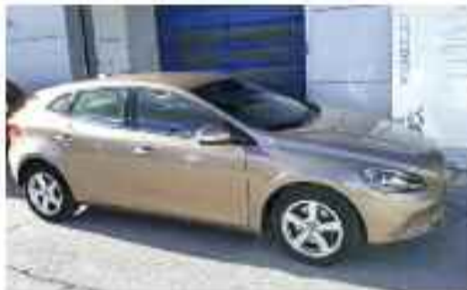
VOLVO V40 D2 KINETIC (120 CV) Compacto | Diesel | Cambio manual | 5 puertas | 5 plazas | 63.000 kms Precio Oferta: 14.650 €

REVISADO MÁS DE 100 PUNTOS DE CONTROL ACTUALIZACIÓN DE SOFTWARE KILOMETRAJE VERIFICADO