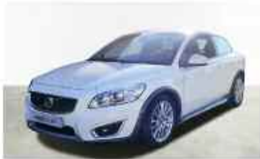
VOLVO C 30 1.6 D 109 CV Compacto | Diesel | Cambio manual | 3 puertas | 4 plazas | 81.500 kms Precio Oferta: 10.900 €