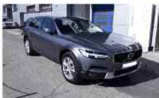
VOLVO V90 CROSS COUNTRY 2.0 D4 AWD AUTO (190CV) Familiar | Diesel | 5 puertas | 30.000 kms Precio Oferta: 43.000 €